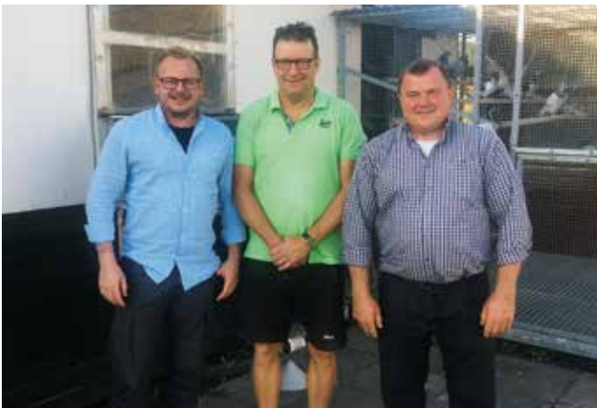
På besøg Peet