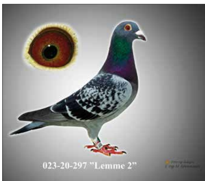
023-20-297 "Lemme II"