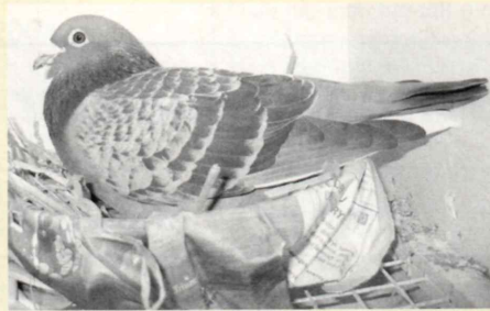
023-02-0455 tavlet han. Placeringer til mesterskabet: 7/6 Neumünster 14/546. 5/7 Altona 8/599.